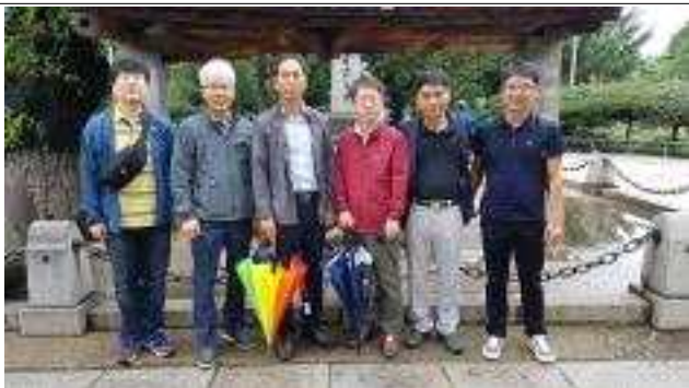
룽징 용두레 우물