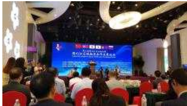
두만강 포럼 회의장