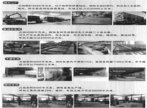
△ 공장 내부 전경 홍보용 리플렛