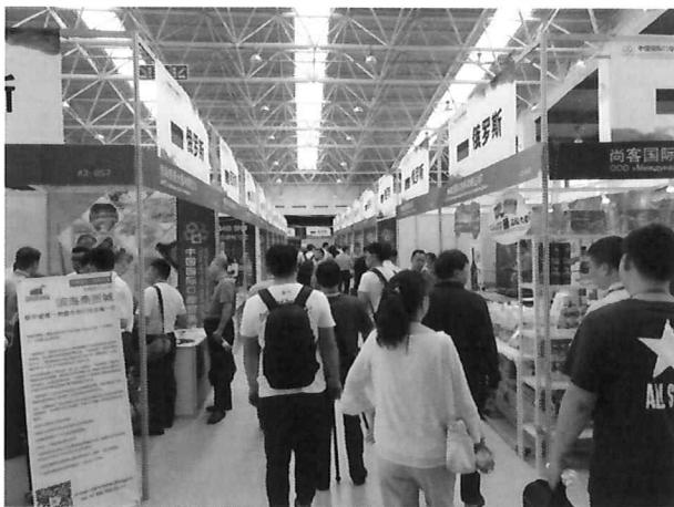
△ 러시아 전시관