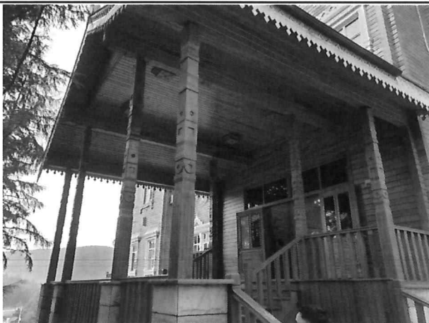
△ 목조 케노피