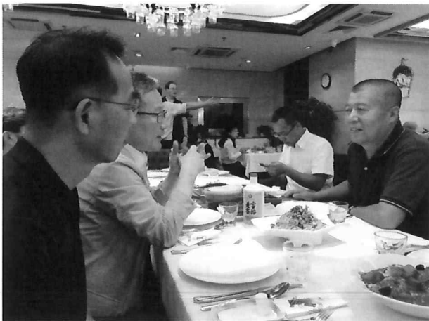
△ 흑룡강성인민정부수분하외사처 부처장