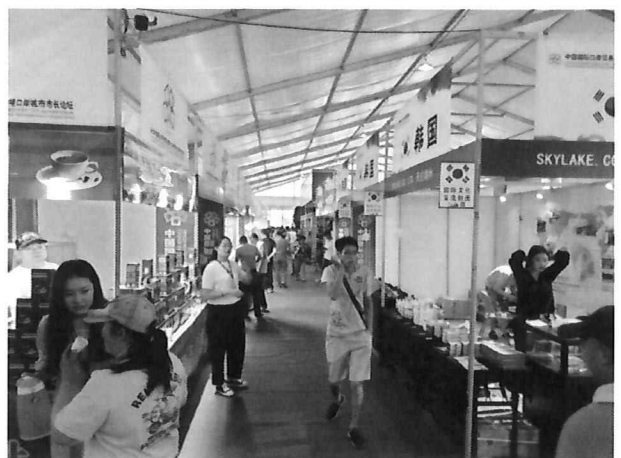
△ 대한민국 전시관