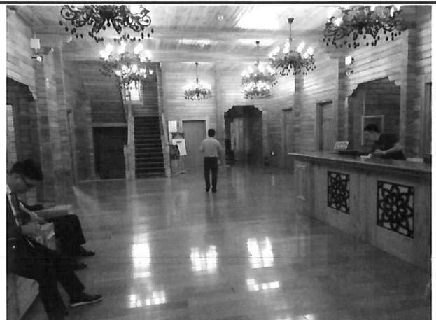
△ 목조 로비 및 안내데스크