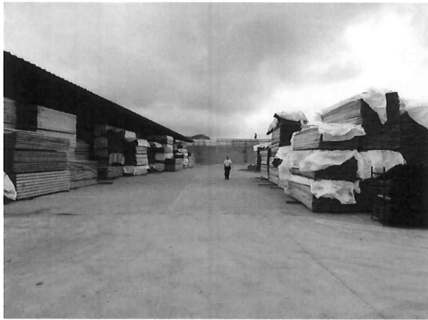
△ 러시아산 목재 수입 자재