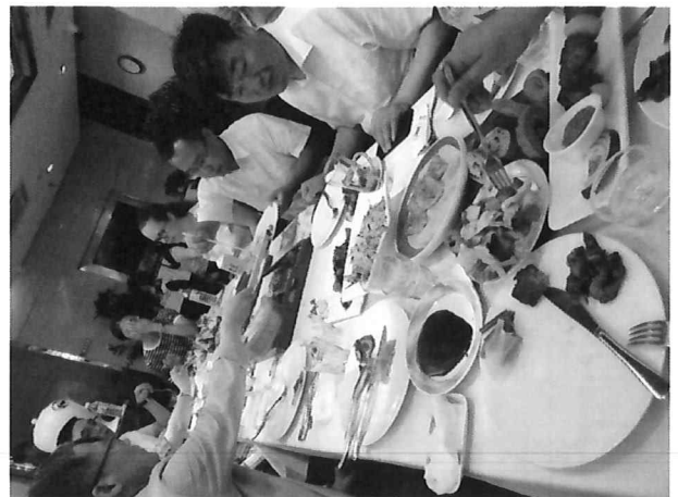
△ 흑룡강성인민정부수분하외사처 처장