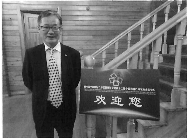
△ 개막식(1층 안내판)