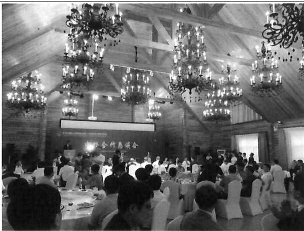
△ 개막식(3층 연회장)