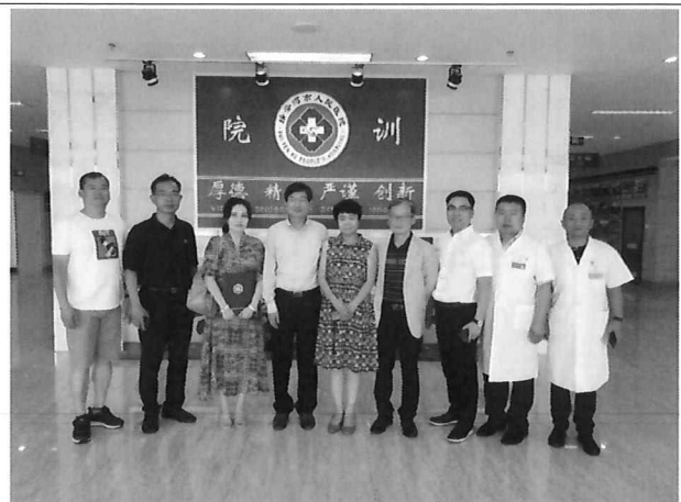
△ 쉐이펀허시 종합건강의료원