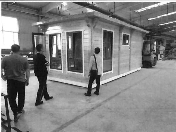
△ 목재가공 후 견본주택