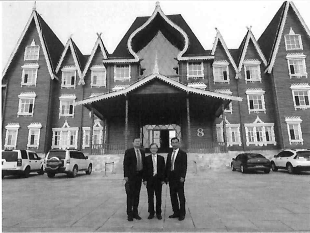
△ 천장산 호텔(목조 건축물)