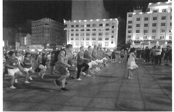
△ 오후 7:00~9:00 쉬이성 호텔앞 광장에서 협동과 단결의 상징이 되버린 셔플댄스