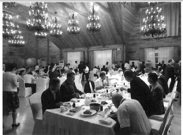
△ 개막식 만찬(3층 연회장)